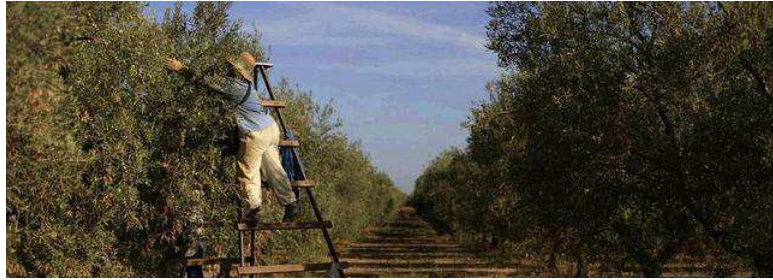
El olivo da problemas a los alérgicos desde enero hasta el mismo mes de julio.

09.04.14 - 13:46 - SALUD REVISTA.ES | Madrid